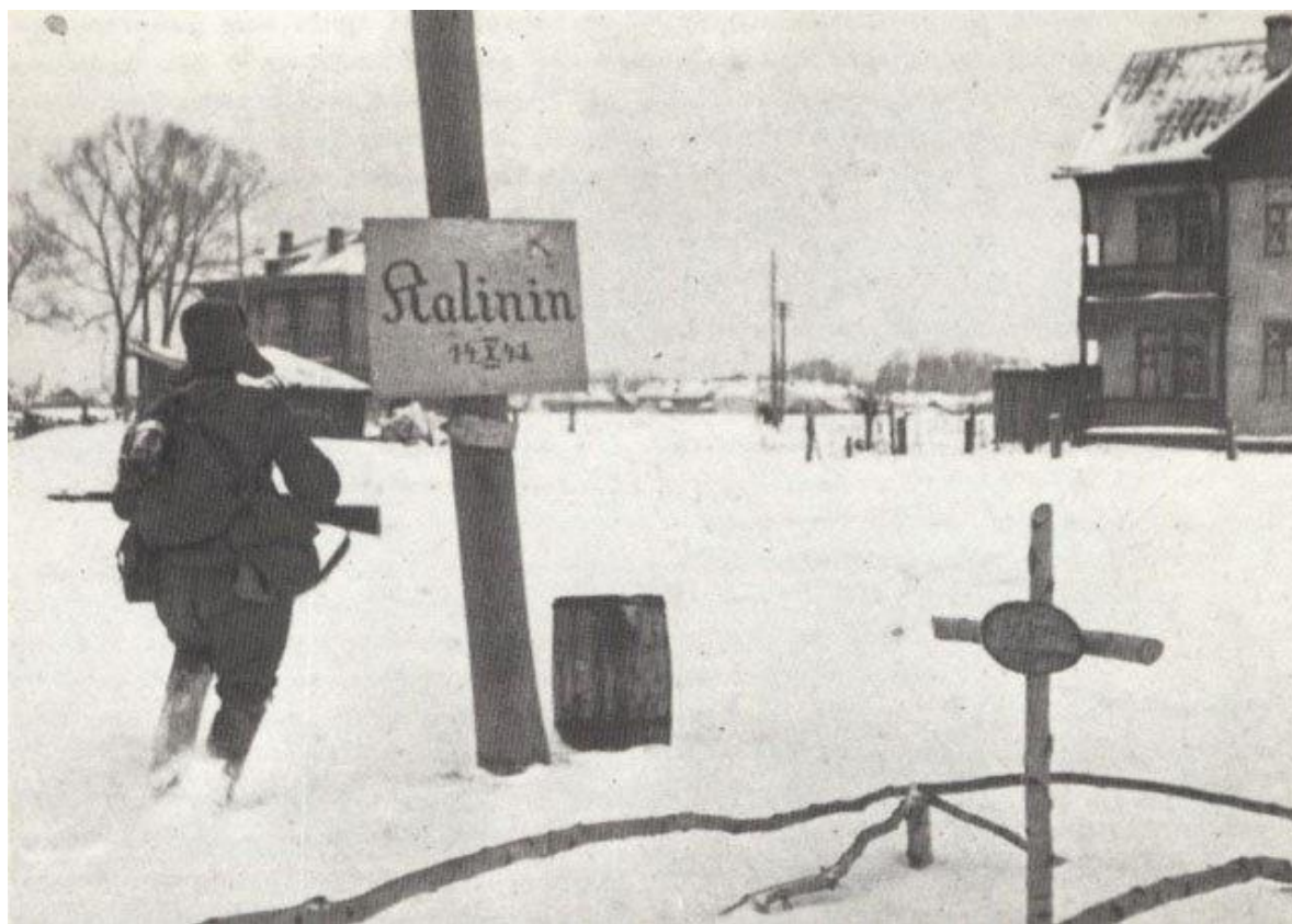
На аншлаге надпись готическим шрифтом Kalinin и дата 14.X.41 — дата начала оккупации

4 ноября 2010 года Твери присвоено почетное звание Российской Федерации «Город воинской славы».