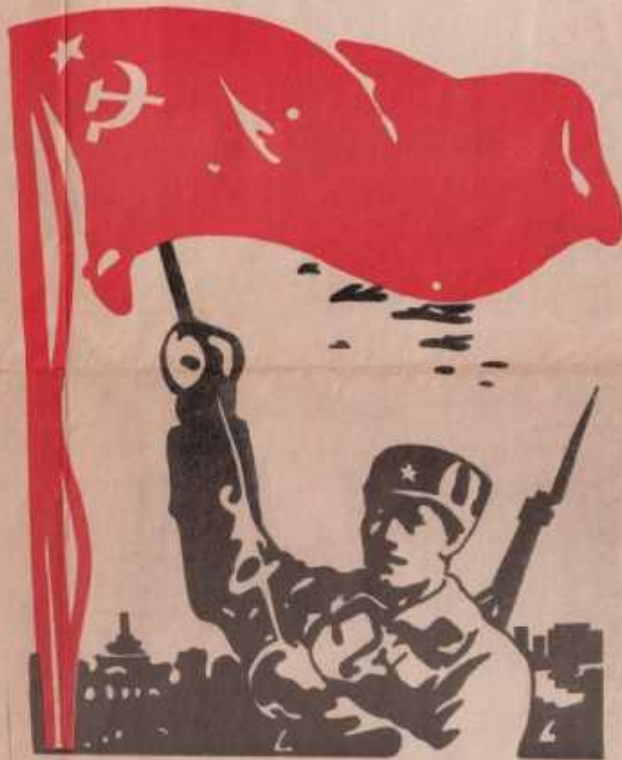
Рисунок И. ЕГОРОВА

Приведшая этот членский группам и минимизировать сотрудничество, встает проблема углубленного сотрудничества на производственных объектах. На отдельных участках монета Калинин протекание переводит в контрпункт с титаником. Ничья часть, самая сотрудничество фашистов, гоним на ее пути отступления.